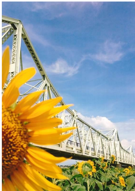
小中学生部門 最優秀賞作品 永村 拓磨 様「青空輝く長生橋」

【会場】 アオーレ長岡 西棟 3 階 市民協働センター （住所：長岡市大手通 1-4-10）